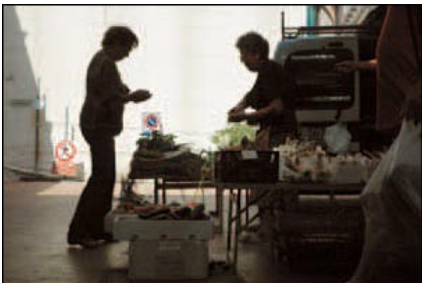
Alcune donne al mercato coperto di piazza del Popolo, a Cesena.