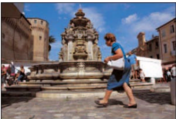
La fontana Masini, a Cesena.

Il vescovo l'ha scritto nell'ultima lettera pastorale lanciando la nuova iniziativa della diocesi che si chiama appunto "Dialoghi per la città". «Si tratta di un ciclo d'appuntamenti», spiega monsignor Lanfranchi, «una sorta di percorso di riflessione e di proposta in cui mettere in relazione le attese umane e il dono della fede, ragione e speranza, sul tema del senso della vita. Incontri aperti a tutti, credenti e non». E sono stati appuntamenti grematissimi, svoltisi in un luogo laico, come l'aula magna della facoltà di Psicologia.