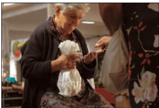
Un'anziana contadina vende i prodotti del proprio orto al mercato coperto di Cesena.

D'altra parte, qui come altrove, tacere significa esporsi ancor più al rischio dell'irrilevanza civile. «Recuperare l'impegno politico come servizio alla carità è un dovere dei cattolici, altrimenti saremo condannati alla marginalità». Parola di Damiano Zoffoli, di professione dentista, sindaco di Cesenatico dal '97 al 2005, da una vita in Ac. Sceso in campo per la passione politica ispiratagli da Benigno Zaccagnini, è stato il primo sindaco cattolico, in una cittadina rossa e repubblicana, che ha due patroni, san Giacomo, e "san" Giuseppe Garibaldi che passò di qua fuggendo a Venezia, e che è il nume tutelare dei repubblicani.