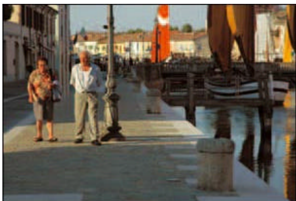
Il porto di Cesenatico.