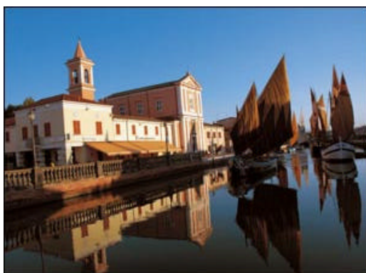
Uno scorcio del porto di Cesenatico.

Dalla battaglia alla roccia. Dalle spiagge assolate della Riviera alle nevi del Fumaiolo. Dal fragoroso divertimentificio no-stop di Cesenatico alle residue frazioni di montagna che si vuotano d'uomini e voci. È due in uno il territorio di Cesena e della diocesi che porta il suo nome, ma anche quello dell'antica orgogliosa Sarsina; due in uno, appunto. È una lunga strada in salita: parte dai rettilinei centuriati che lambiscono le spiagge adriatiche, passa tra dolci paesaggi di ciliegi e si fa spigolosa impennandosi tra le montagne che, in sella, sapeva domare solo quel cesenate doc dallo sguardo triste che si chiamava Marco Pantani. Due cattedrali, due cucine, due modi di vivere, due culture, «tra 'l piano e il monte, tra tirannia e stato franco», come già tratteggiava questa terra Dante, nel XXVII canto dell'Inferno, tra Romagna e Montefeltro, romani e longobardi, democristiani e comunisti, cattolici e repubblicani. Forse proprio perché siamo in una terra dai forti contrasti, dai toni forti che in passato hanno causato scontri e contrapposizioni violente, a emergere è chi sa fare sintesi nuova, unire il meglio dei due mondi, chi fa scelte anticonformiste, senza perdere l'identità. È un po' la sfida della Chiesa e dei credenti cesenati, oggi.